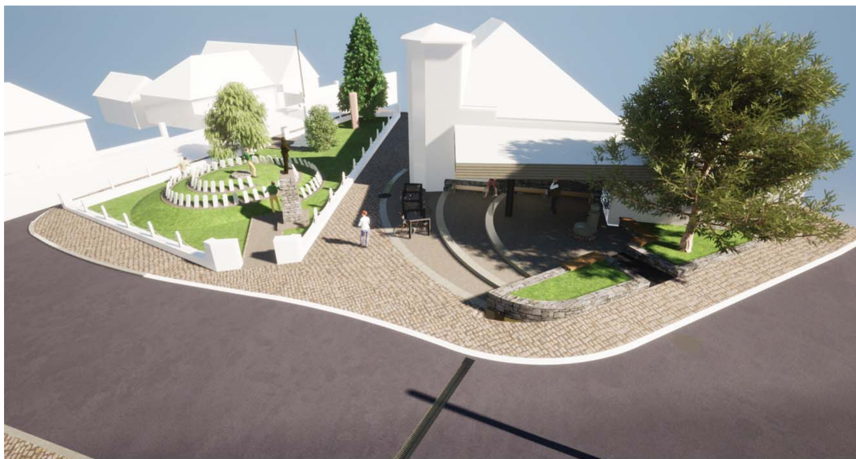
Hősök kertje és felette lévő térrész 1.