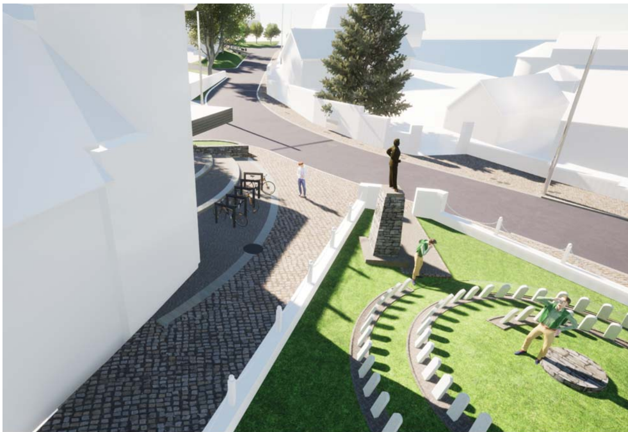
Hősök kertje és felette lévő térrész 2.