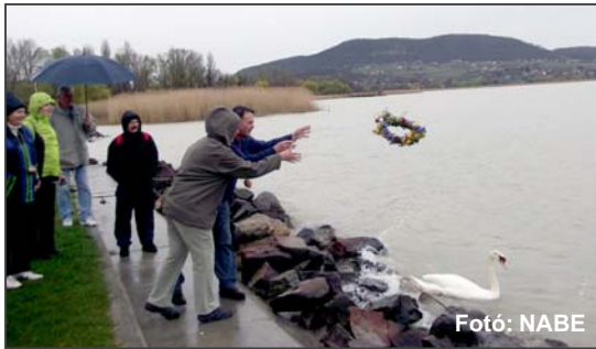
A Badacsonyon tett személygyűjtő túra után a Balatont is megkoszorúzták a NABE a Víz világnapján