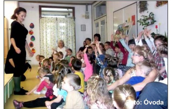
A Kabóca Bábszínház Gomboló című előadását tartotta a badacsonytomaji Pipitér Óvodában március 3-án. A művészi előadás lenyűgözte az óvodás gyermekeket, akik csillagot tekintettel, kitaró figyelemmel és derűltséggel kísérték végig a mesejátékot